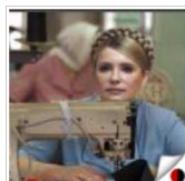
Тимошенко шитиме вушанки