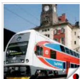
З Харкова до Донецька ходитимуть двоповерхові поїзди