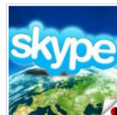
В Україні можуть оподаткувати Skype, - tsn.ua