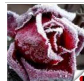
Цього тижня обіцяють до -30