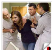
Леди Ю проклала посаду Президента