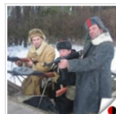
Один день из жизни партизан глазами журналиста